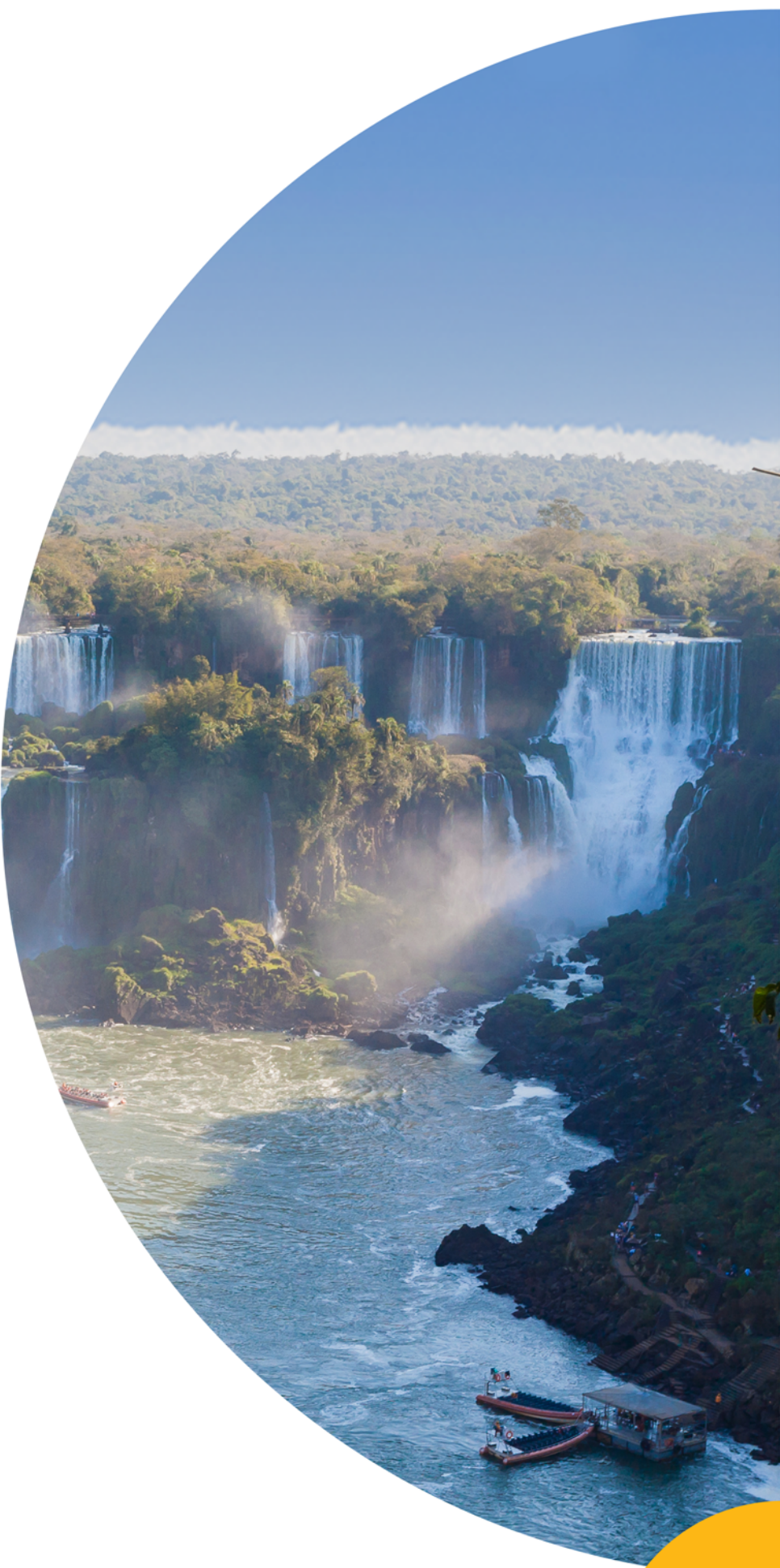
CATARATAS DO IGUAÇU