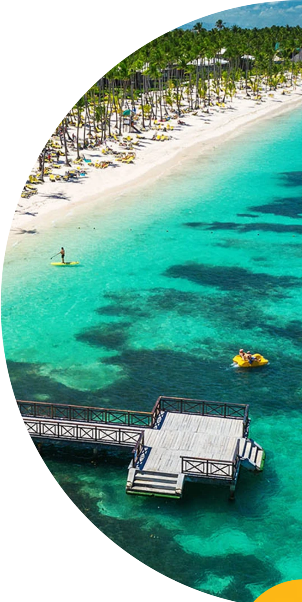
PUNTA CANA ALL INCLUSIVE