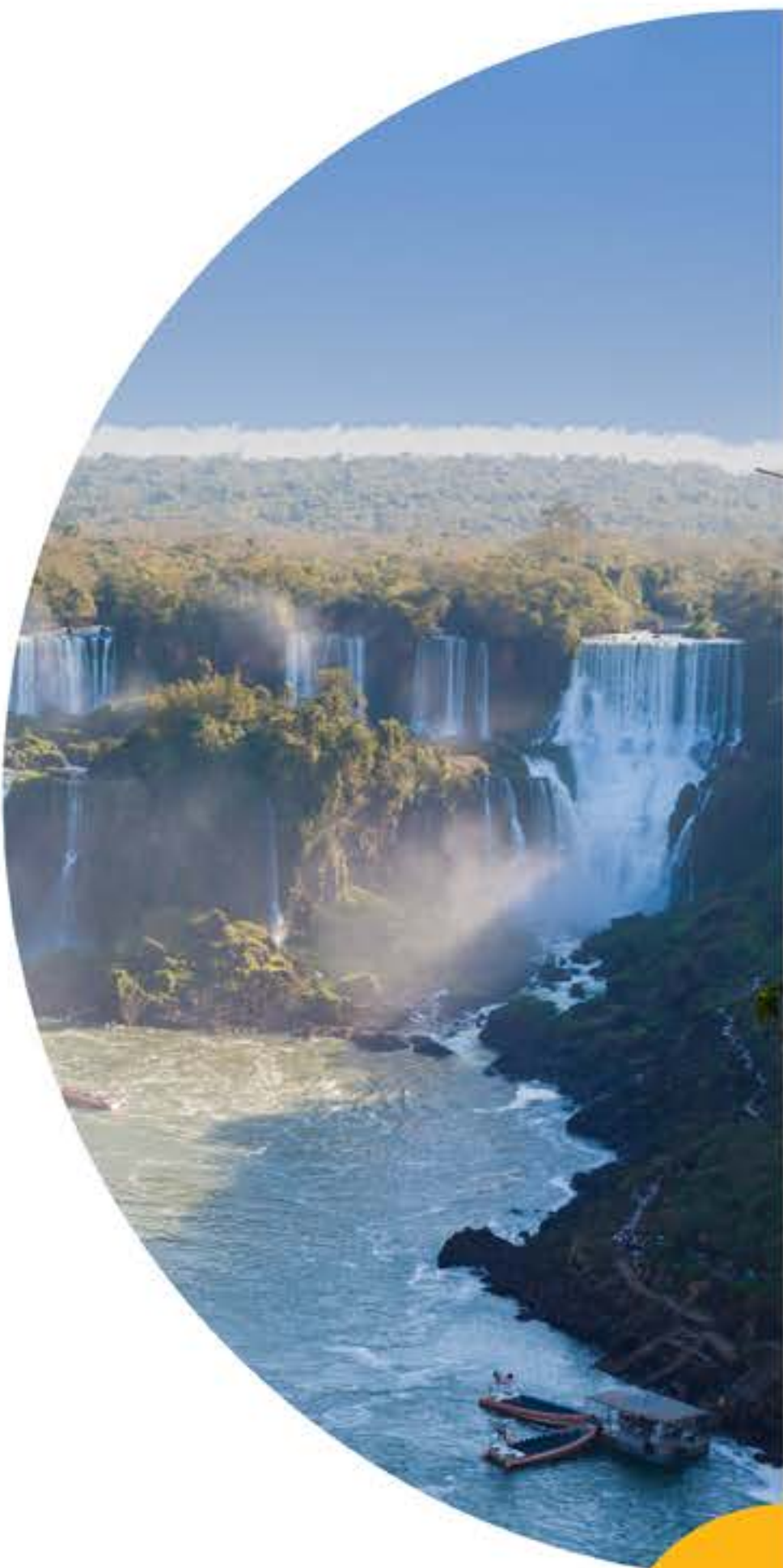
CATARATAS DO IGUAÇU