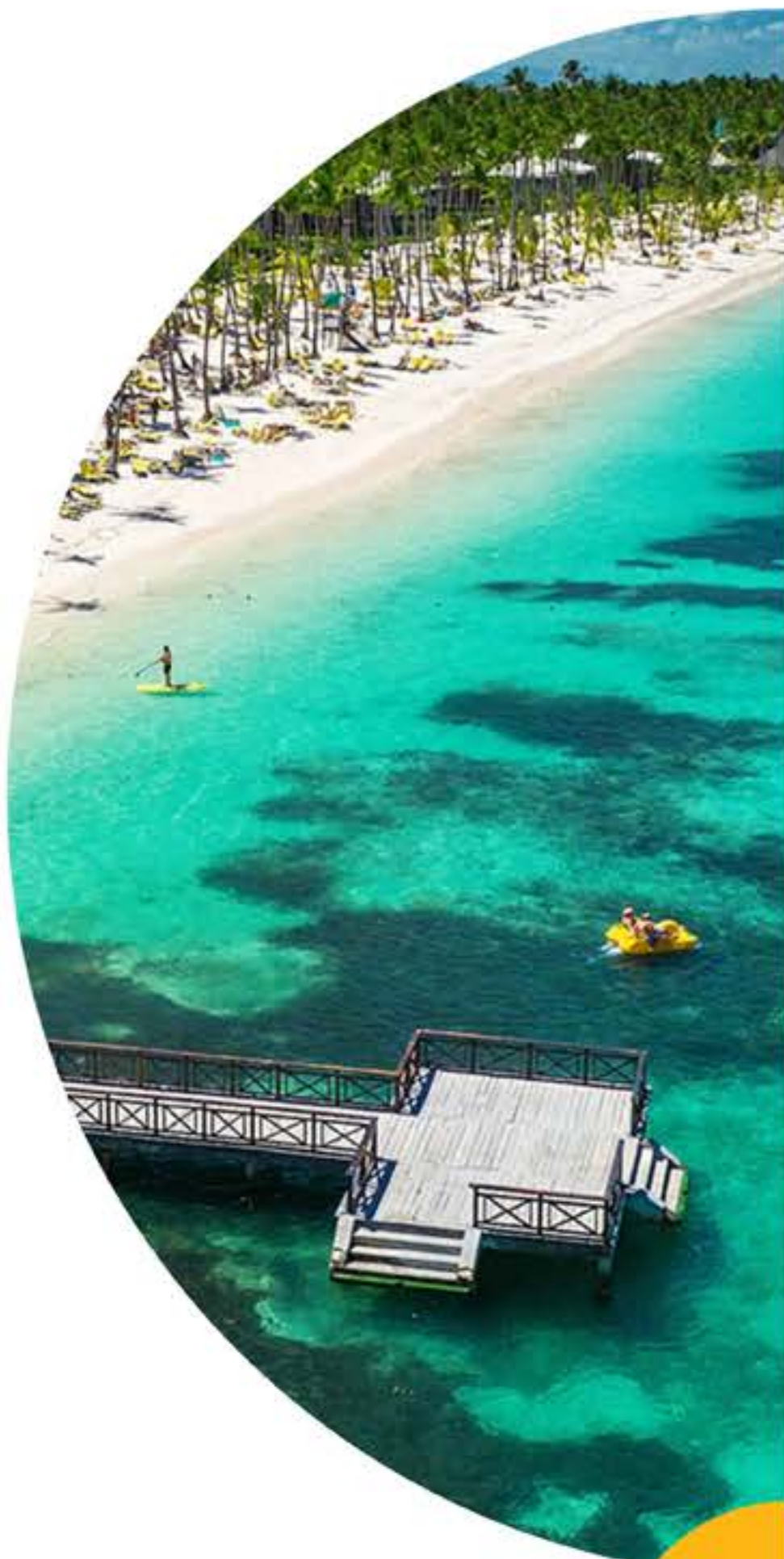
PUNTA CANA ALL INCLUSIVE