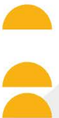
SÃO MIGUEL DOS MILAGRES